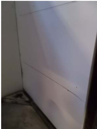
Abb: Kante großer Probenflügel

Materialaufbau und Befestigung siehe Fotos: